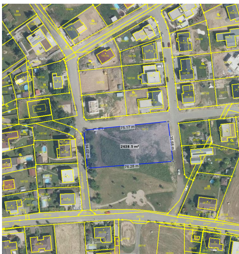
Znázornění řešeného území na podkladu ortofotomapy.