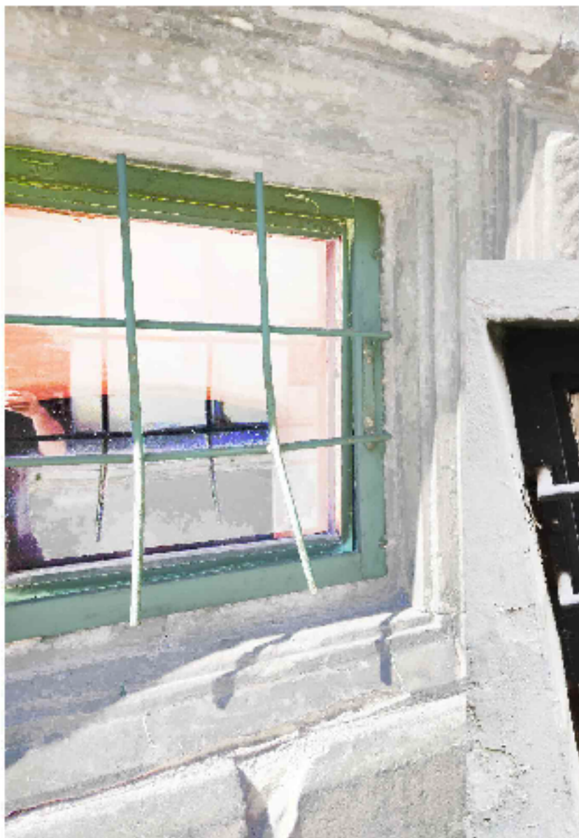
SUTERÉNNÍ OKNA DO ULICE MARKOVA