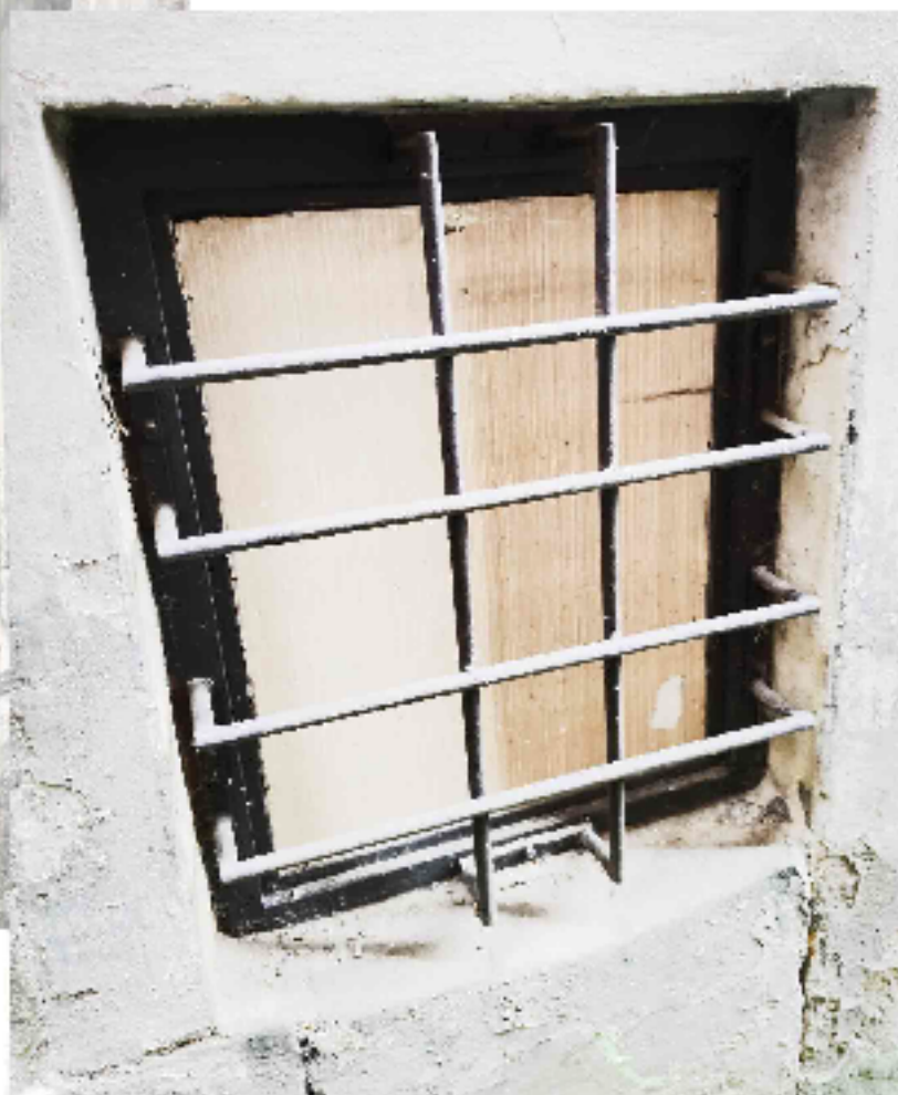
SUTERÉNNÍ OKNA DO DVORNÍ ČÁSTI