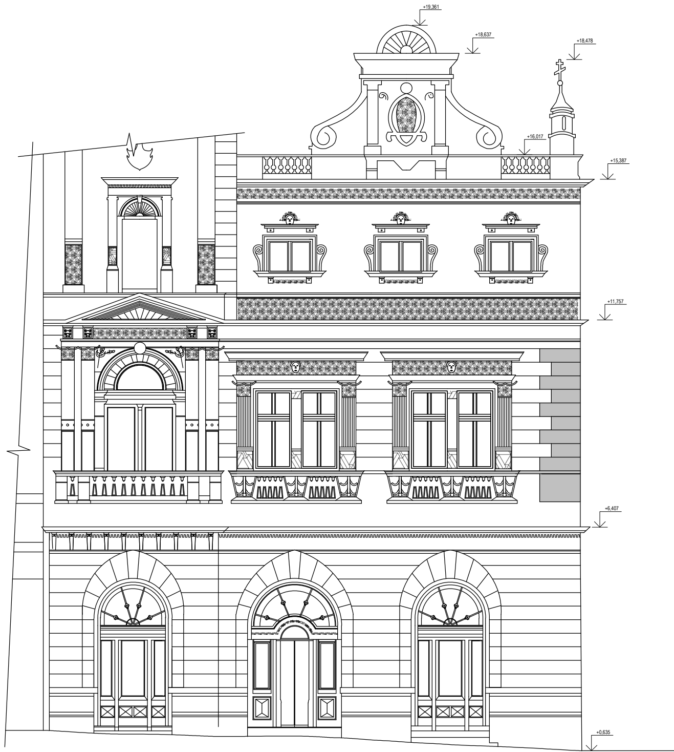
POHLED SEVERNÍ STÁVAJÍCÍ STAV